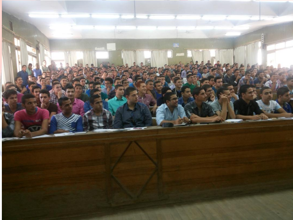
الطلاب اول العام الدراسي ٢٠١٤-٢٠١٥