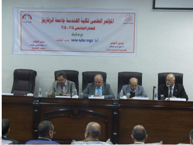
المؤتمر العلمي لكلية الهندسة ٢٠١٤- ٢٠١٥