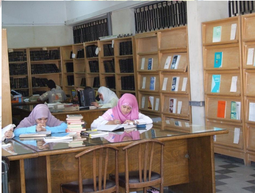
مكتبة كلية الهندسة