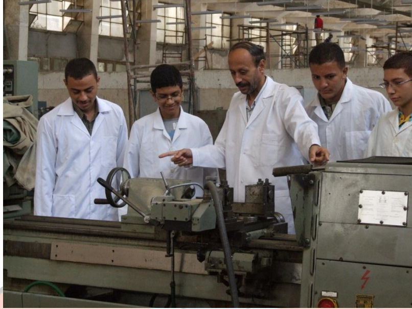
الطلاب بالورش التعليمية