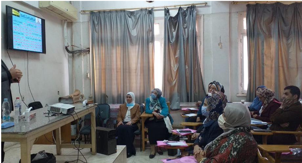
ورشة عمل ضمن أنشطة التعليم الطبي المستمر بعنوان: "التزييف و التزوير"