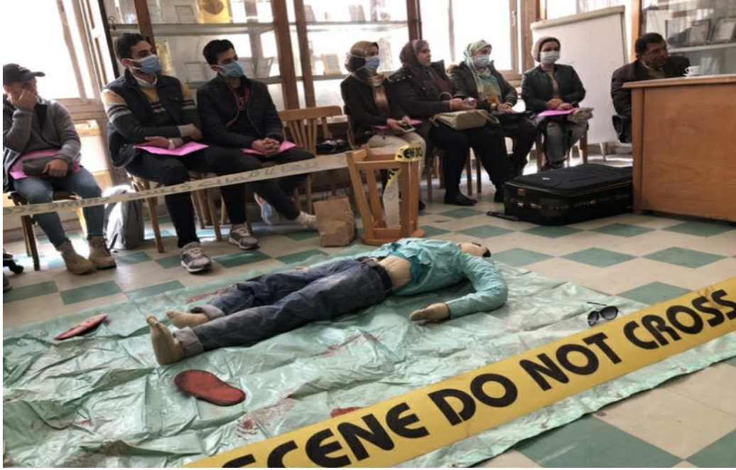
ورشة عمل ضمن أنشطة التعليم الطبي المستمر بعنوان: "الفحص الفني لمسرح الجريمة"

قسم الطب الشرعي والسموم الاكلينيكية مركز الاستشارات الطبية الشرعية