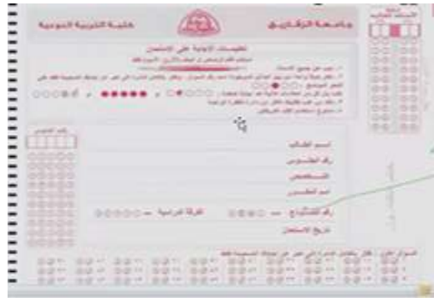
البرنامج التدريبي : المنصة الإلكترونية Microsoft Teams المعرب : د / سماح زغلول، اللغة المستهدفة: الطلاب. التاريخ : الأرياءء الموافق 2021/12/1

ندوة ( المانو تكنولوجي بين النظرية والتطبيق )