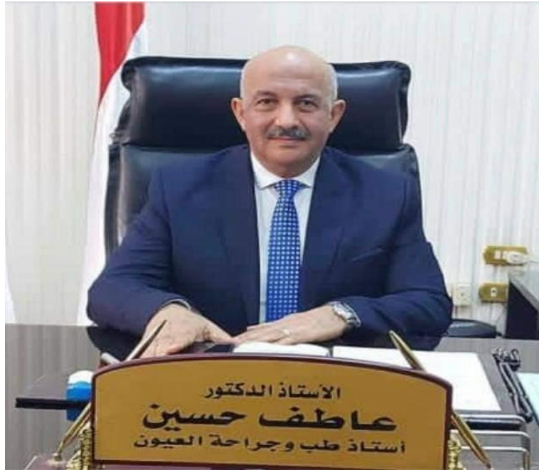
معالي الاستاذ الدكتور / عاطف حسين نائب رئيس الجامعة لشئون التعليم والطلاب