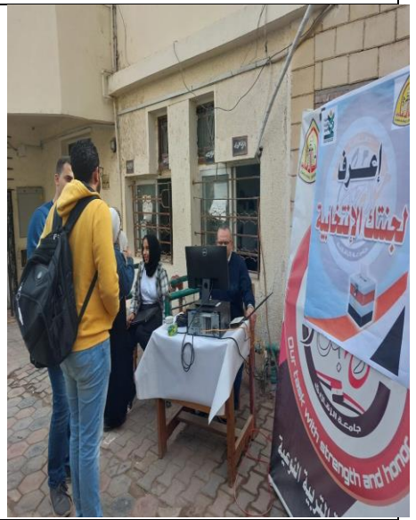
انجازات قطاع التعليم والطلاب بكلية التربية النوعية جامعة الزقازيق ٢٠٢٣/٢٠٢٤م