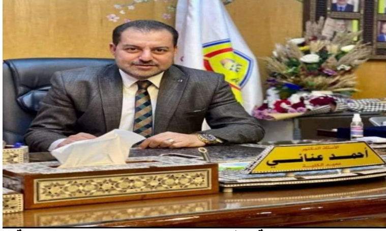
معالي الاستاذ الدكتور / احمد عناني عميد كلية الطب البشري ومستشار رئيس الجامعة للانشطة الطلابية