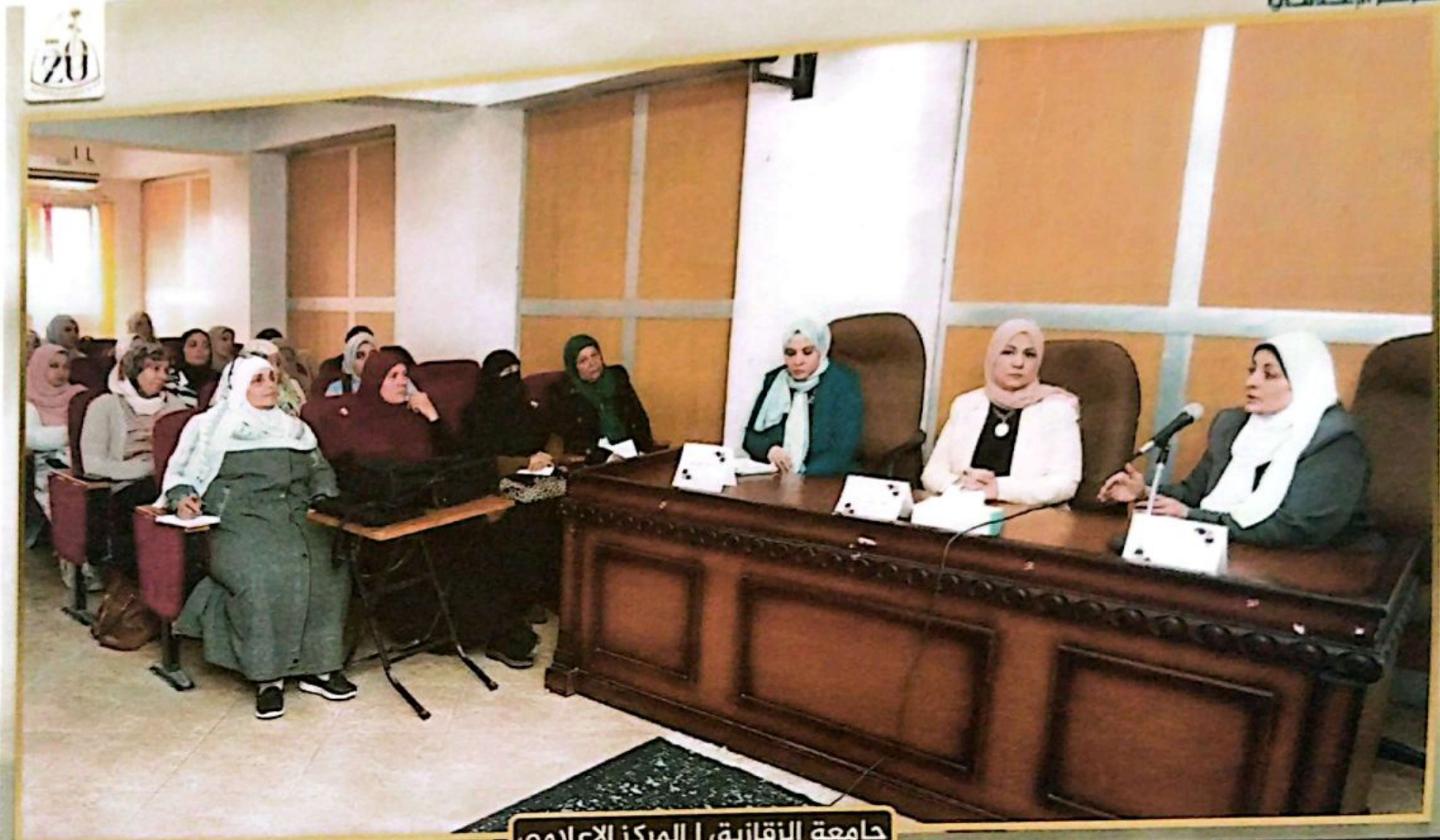
جامعة الزقازيق | المركز الإعلامي

الصفحة الرسمية للمركز الإعلامي لجامعة الزقازيق