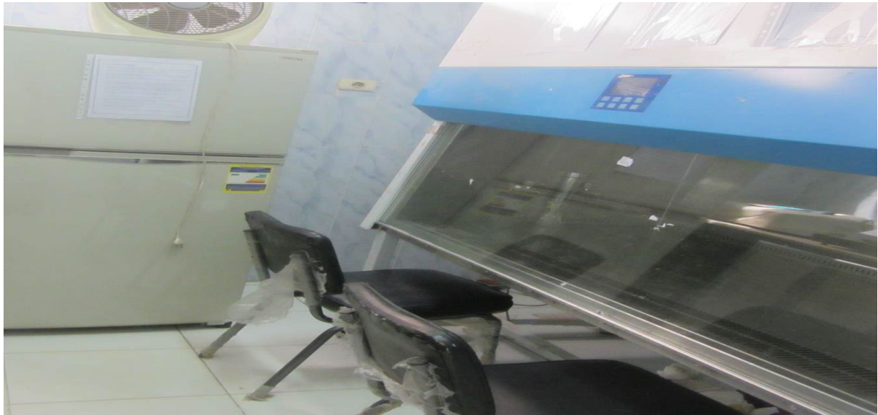
Safety cabinet class II