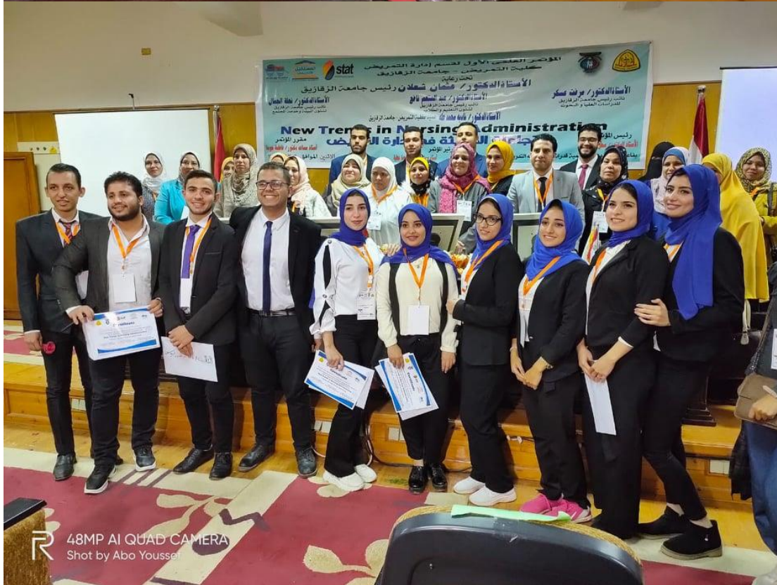
48MP AI QUAD CAMERA