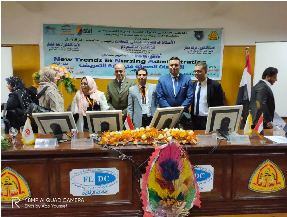
48MP AI QUAD CAMERA